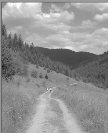
Láska má pokračovanie